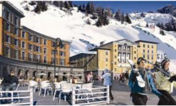
Swissôtel Gorky Gorod ***** (158 camere) 2013