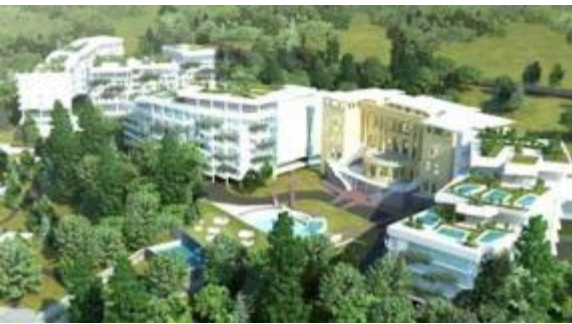
Swissôtel Sochi Kamelia ***** (200 camere) 2013