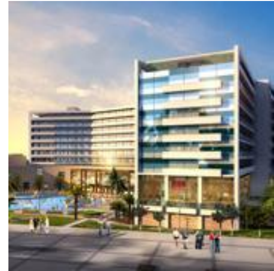
Radisson Blu resort & Congress Sochi ***** (500 camere) 2013