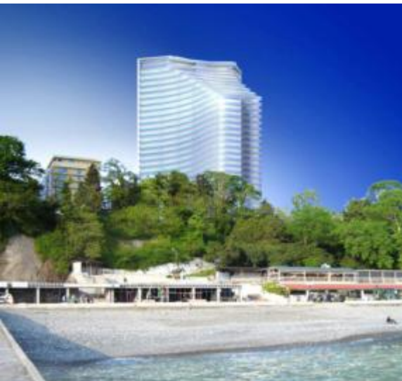
Hyatt Regency Sochi ***** (200 camere) 2013